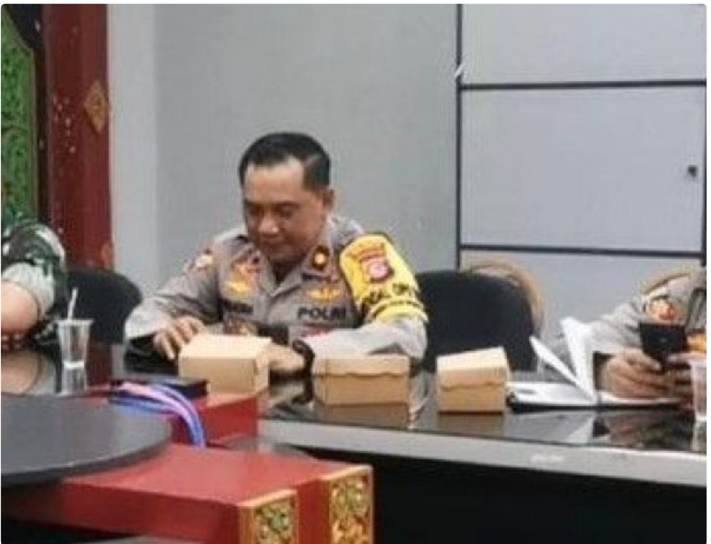
Kabagops Polresta Mataram saat menghadiri Rakor di Kantor Bupati Lombok Barat, Selasa (10/12/2024)